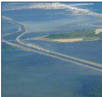
Canal des Etangs

Afin de prendre en compte les contraintes environnementales des étangs palavasiens, le mauvais état de la berge Nord et les disponibilités du domaine public fluvial au Sud, le parti pris d'aménagement retenu consiste à terrasser et à élargir le canal côté Sud permettant à la berge Nord de ne pas subir de fortes sollicitations au passage des bateaux et de trouver ainsi un profil d'équilibre.