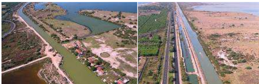
Canal du Rhône à Sète - La ligne droite de Carnon