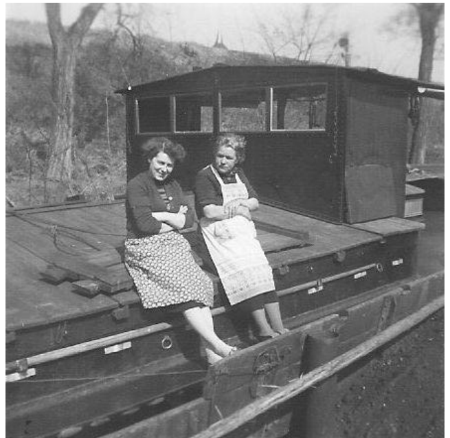
hinten offenes Steuerhaus und Heckankerspill nach 1956