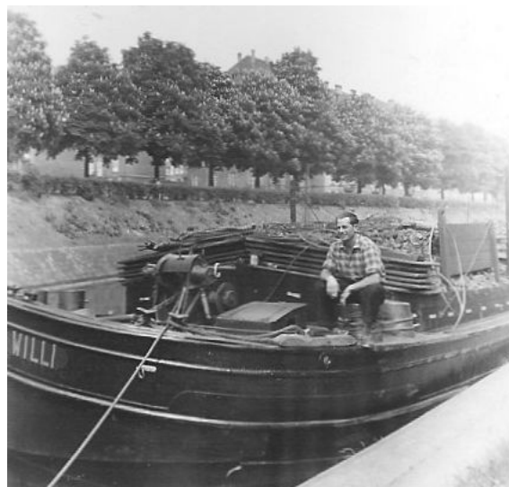
Das Vorschiff nach 1956