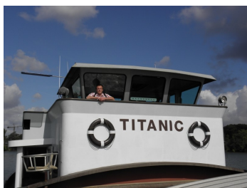
Le TITANIC à Vernon (Eure)