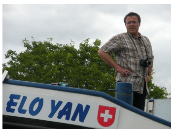
Le ELO YAN à l'écluse de l'Espérance